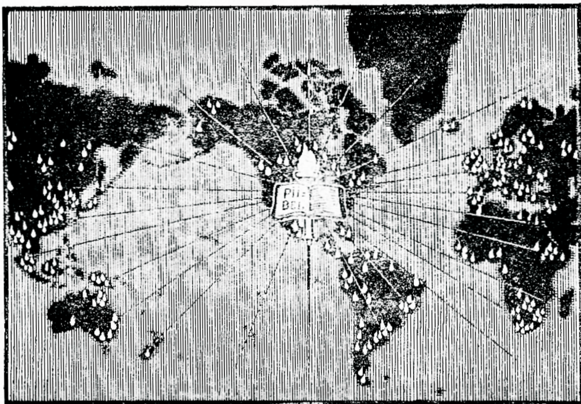
Piibel — ainjam õige walguse näitaja ja rahutee juht keset waimilises pimeduses ümbereksijat rahwamerd.

Mõtelge selle inimolewuste sõjawäe peale, kes teostawad selle hirmsa kuriteo, wõttes